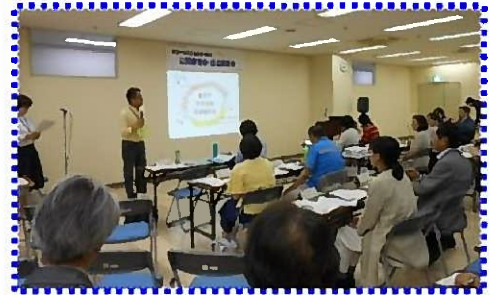
＜昨年度の公開審査会の様子＞