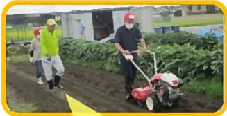
上郷：耕運機操作、ドキドキ