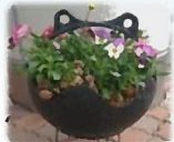
↑浮き玉プランター

日時：9月24日(金)10:00~12:00 会場：西山公園 大型ハウス(ほか) 対象：市内在住の方 参加費：1,000円(保険代含む) 持ち物：飲み物、筆記用具、ぐん手 服装：汚れても良い服