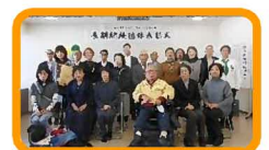
とよた市民活動センター 長期継続団体