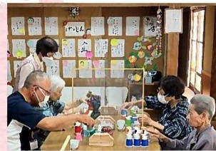
▲福祉のお仕事(実習)