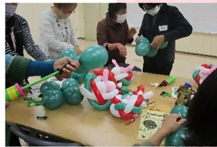
▲バルーンのリース作り