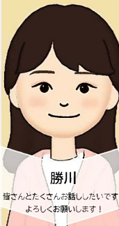
勝川 皆さんとたくさんお話ししたいです！ よろしくお願ひします！