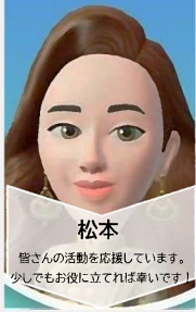
松本 皆さんの活動を応援しています。 少しでもお役に立てれば幸いです。