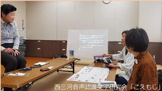
西三河音声認識文字研究会「こえもじ」