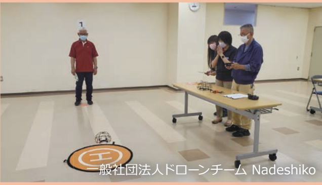
一般社団法人ドローンチーム Nadeshiko