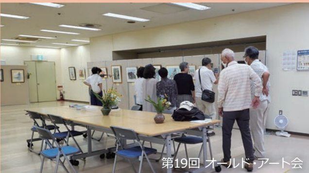
第19回 オールド・アート会