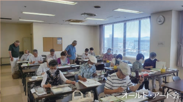
オールド・アート会