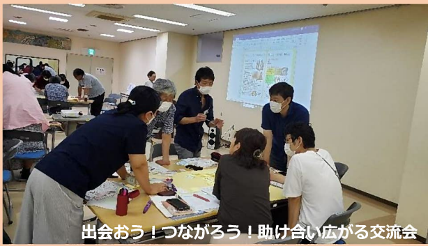
出会おう！つながろう！助け合い広がる交流会