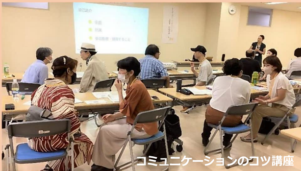
コミュニケーションのコツ講座