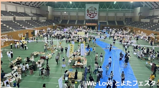
WE LOVE とよたフェスタ