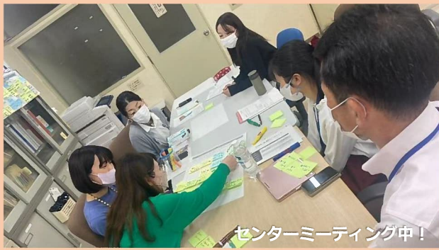
センターミーティング中!