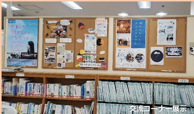
交流コーナー展示