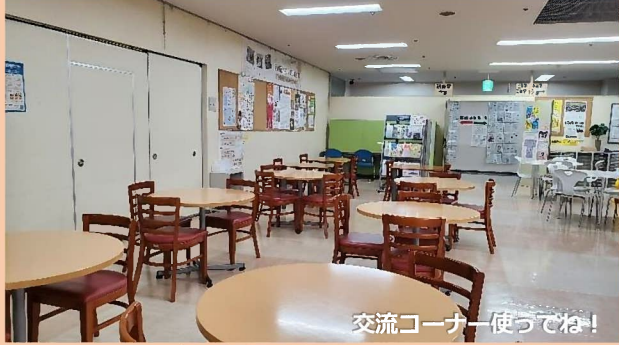
交流コーナー使っでね!