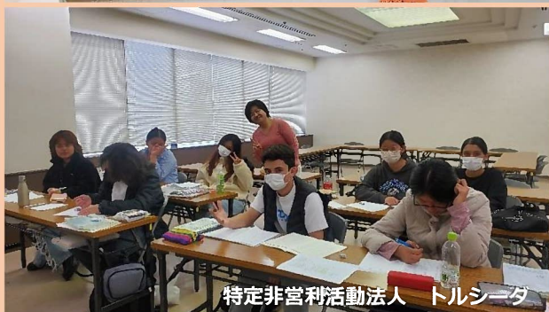
特定非営利活動法人 トルシーダ