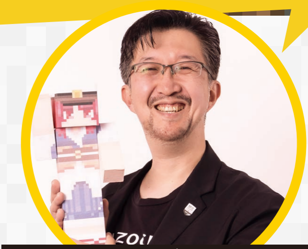
2011 全国大会審査員長 プロマイクラフター タツナミ シュウイチ